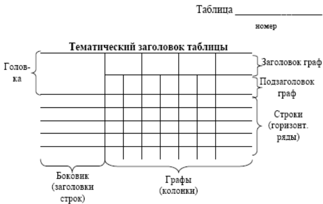
Рис. 1. Структура таблицы